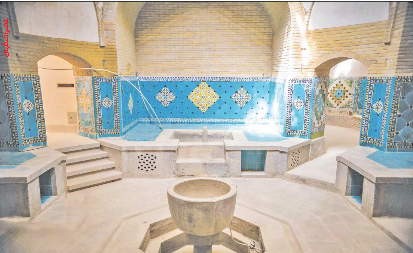
موزه گرمابه شاهزاده‌ها، پلکانی به تاریخ