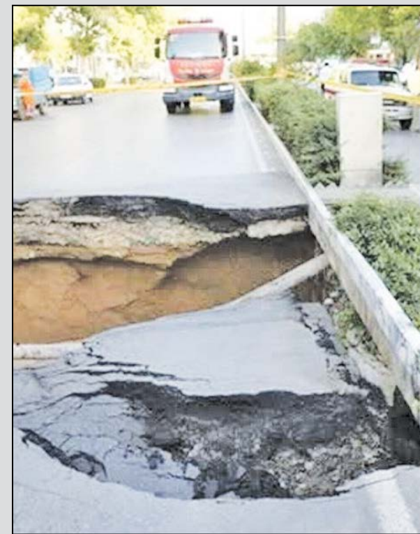
نشست دوباره زمین در خیابان میر

سارق ۱۵۰ میلیارد ریالی منزل در اصفهان دستگیر شد